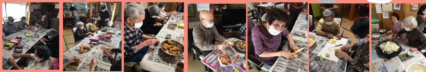
メニューは「マカロニグラタン☆」利用者自身で、むいて、切って、炒めて、召し上がって頂きました